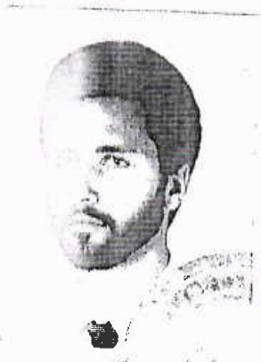
Чл. 36а, ал. 3 от ЗОП във вр. с чл. 2 от ЗЗЛД