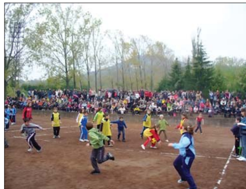
СОУ „М. Райкович“.

Футболната надпревара при учениците от среден курс - V - VIII клас се оказа доста оспорвана. Организаторите присъдиха на състезаващите се футболни тимове две първи и две втори места. И тук джулюнските отбори показаха по-добри резултати. На двете първи места се класираха отбор V-VI клас и отбор VII-VIII клас на ОУ „П.Р.Славейков“, а на двете втори - отборите от същите класове при