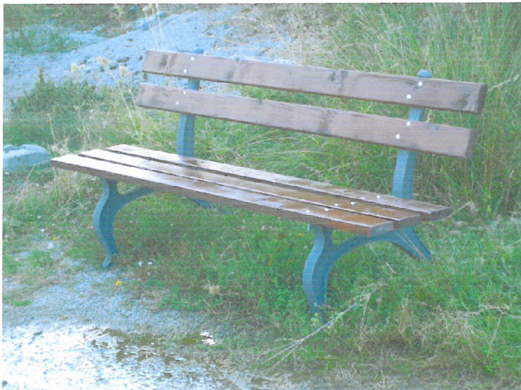
Пейка дървена 180/40/70

ОБЩИНА ЛЯСКОВЕЦ обл. В. ТЪРНОВО на основание чл. 145 ал. 1, уло на 623 от ЗУТ ОДОБРЯВАМ проектна/забележки..... АРХИТЕКТ..... гр. Лясковец, 25.07. 2003 г.